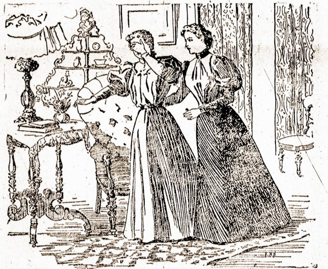
SHE WAS BLIND.

A blindness comes to me now and then. I have it now. It is queer—I can see your eyes but not your nose. I can't read because some of the letters are blurred; dark spots cover them; it is very uncomfortable. I know all about it; it's DYSPEPSIA. Take one of these; it will cure you in ten minutes. What is it? A Ripans Tabule.