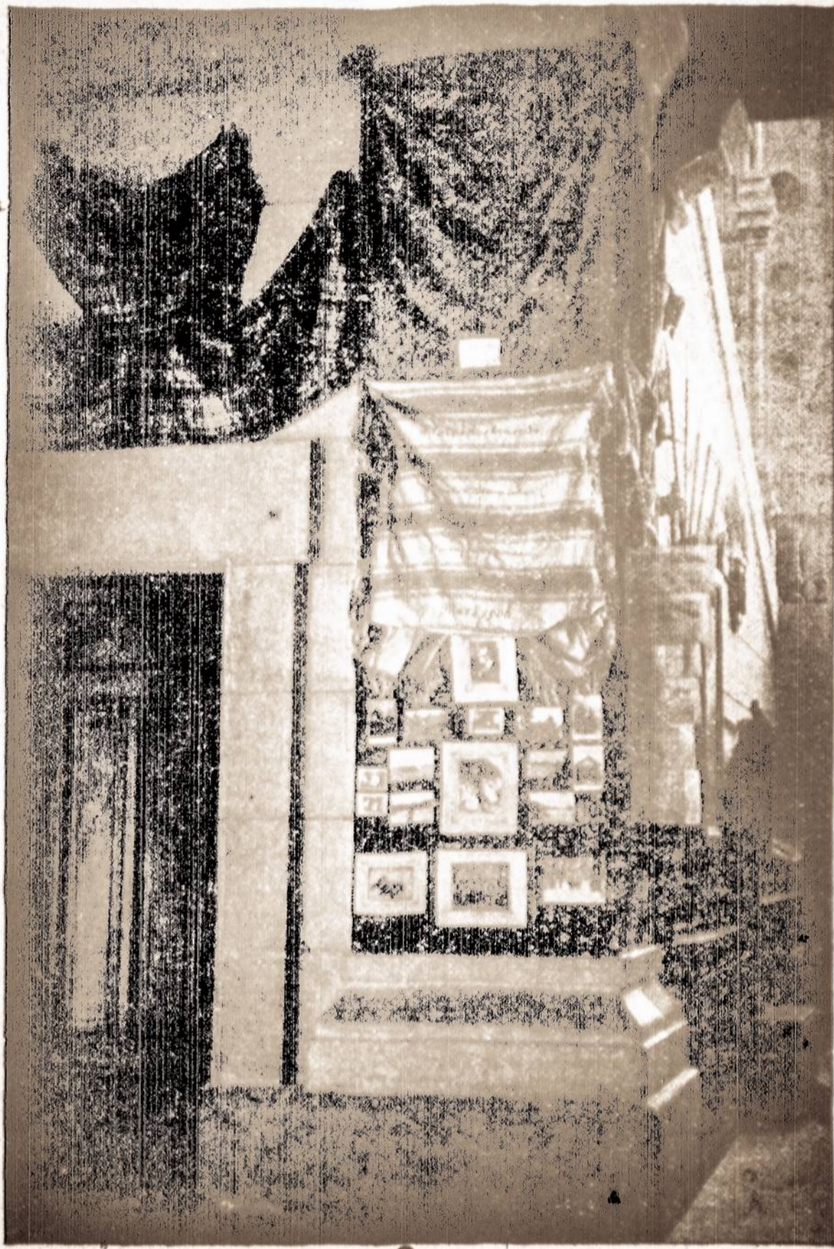
Prusų Lietuvos iszdarbiai, ukiszki paveiksiai ir laikraszcziai su gotiszkomis raidėms.

Gilberton, Pa. Vietinė T. M. D. kuopa ant susirinkimo 9 Rugsėjo nutarė: Paaukauti nors nashlės pinigėlių ant paminklo Dr. V. Kudirkos, kuris pirmasis pagyrė ir rasztais suszelpė T. M. draugystę, ir kuris yra užsipelnęs ant amžinos atminties kaipo nenuoalsus