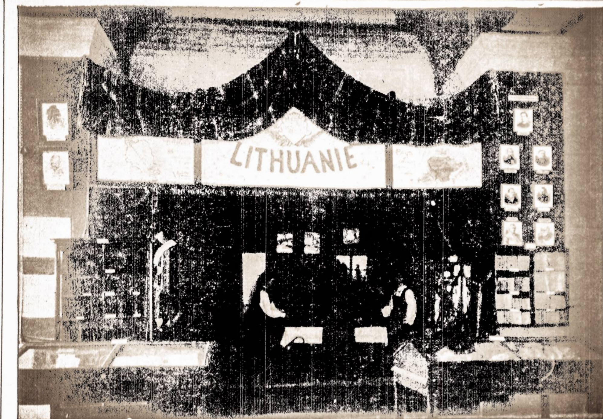
Abelna skyriaus iszveizda žiurint isz pryszakio.

Menominee, Mich. C. Outlette, 47 metų, turejo reumatizmą, ir norėdams jo nusikratyti, apsiėmė iszpildyti nepaprastą gydimo budą, kurį jam