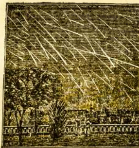
Smarkus žvaigždžių kritimas Lapkričio 1872 m.

Du tarpu per metus tos žvaigždžių skeliaudros sukinais arčiausiai žemės ir tankiaus įkaitusios ore šviečia: tarp dvidešimts antros ir dvidešimts septintos Ruggjuczio ir dvidešimts antros ir dvidešimts septintos Lapkričio matyt, daugiausiai krintančių žvaigždžių. Kartais jų tiek matyt ore, kad rodoti tarytum ugnies lytus ant žemės krinta. Tai ir vadina žvaigždžių lytym.