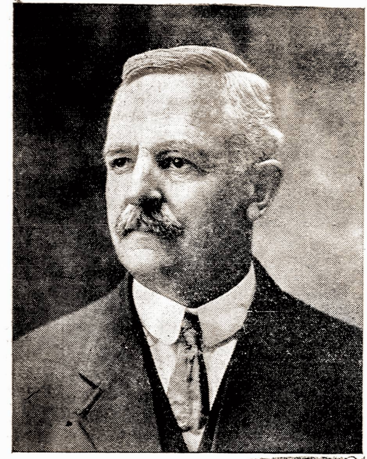
Godotinas A. E. Sisson.

Ledų -krynius (ice-creats), visuomet turi buti užlaikomos švariai, vistiek ar jos butų gyvenamuose namuose ar biznio vietose, nes kitaip jos pavirs į besiveisimo vietas visokių ligų ir greitai pagimdys ligas skilvyje ir zarnose. Visuomet pirkit tiktai geriausių maistą, švarų ir šviežią ir nelaikykit įgari liekanų nuo valgių virtuveje. — Neprileiskite musų prie maisto. — Visuomet turėk savo namuose Frinerio Amerikoniskąjį Elikavę. Karčiojo Vyno ir vartok jį taip tankiai kaip tik pajausi kokią nors permainą savo apetite. Vynas yra labai geras vaistas nuo skilvio ir zarnų ligų, ir taipgi labai gelbsti nuo makraujstės ir abelo silpnumo. Vaistas privers prie darbo gromuliavimo organus, suregulius gromuliavimą ir priduos įgę visam organizmui abelna. Gaunamas aptiekose. Jos. Triner, 1333-1339 So. Ashland ave., Chicago, Ill.