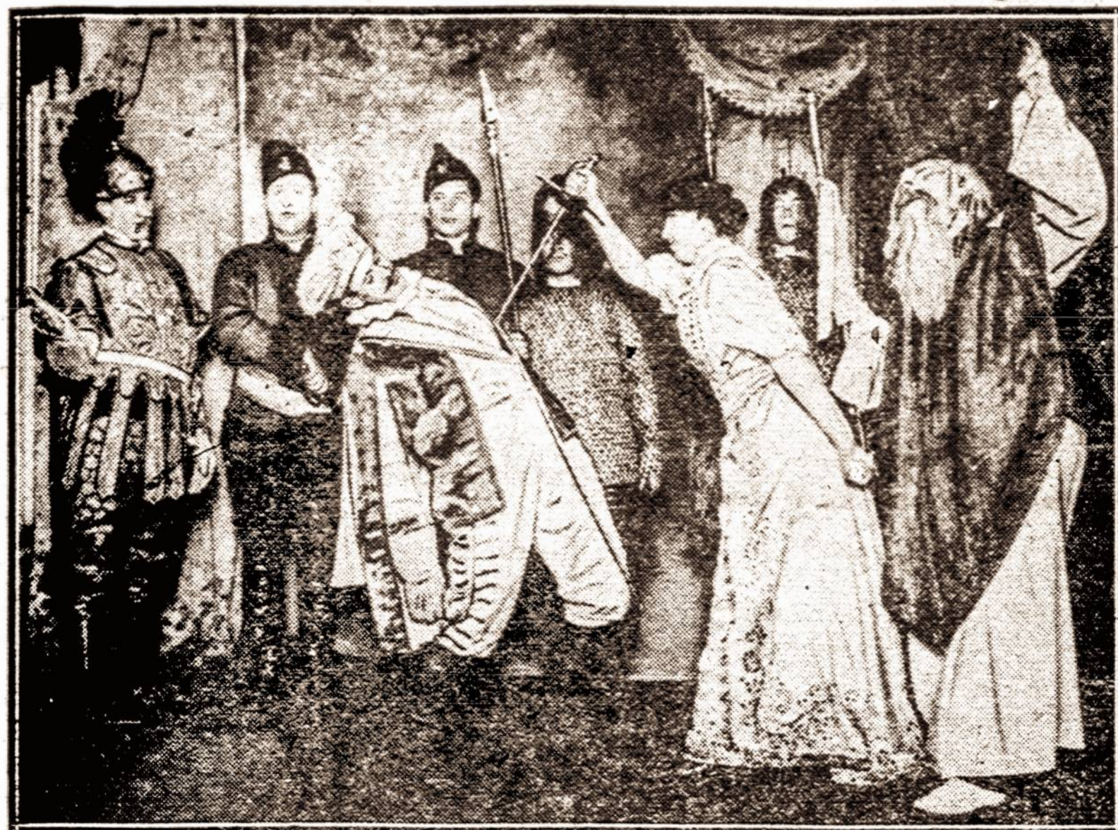
Aktas V. Scena 5.