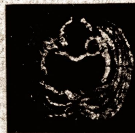
Pirmas šonkaulis. Mentis (clavicula.)

Pirmiansiai mes pakalbėsime apie tą keitimą, kuris atsitinka dar bebunant žmogaus vaisiui motinos yščiuje. Visi—pirmu mes matome (pav. 14), kad šonkauliai eina beveik horizontališkai (skersaguliškai) priešąki, dar net truputi augstyn, jei į juos žiūrēt iš šalies. Po draug galima įžiūrēt, jog šitime vaisiaus periode krutinės klėta, kaip sakēm, daugiau išsivysčiusi gilumon ir ties viršutiniu šonkauliu ji buna ne tik gilesnė, bet ir platesnė. Vėliaus vaisius suanga į 32 millimetru ilgio, šonkauliai pradeda lankties žemyn (pav. 15), o krutinės klėtkos giluma mažėja (žiur. pav. 16). Mes augščiau jau matēm, kad inkvepiant orą šonkauliai darosi skersesni. Iškvepiant gi—atbulai: šonkauliai buna labiau žemyn palinkę, tai yra skiautesni, ir krutinės klėtkos plotis tada jau darosi mažesnis, per tai ir visa krutinė klėtkos intalpa susimaužina. Suprantamas daktas, kad angant vaisiui