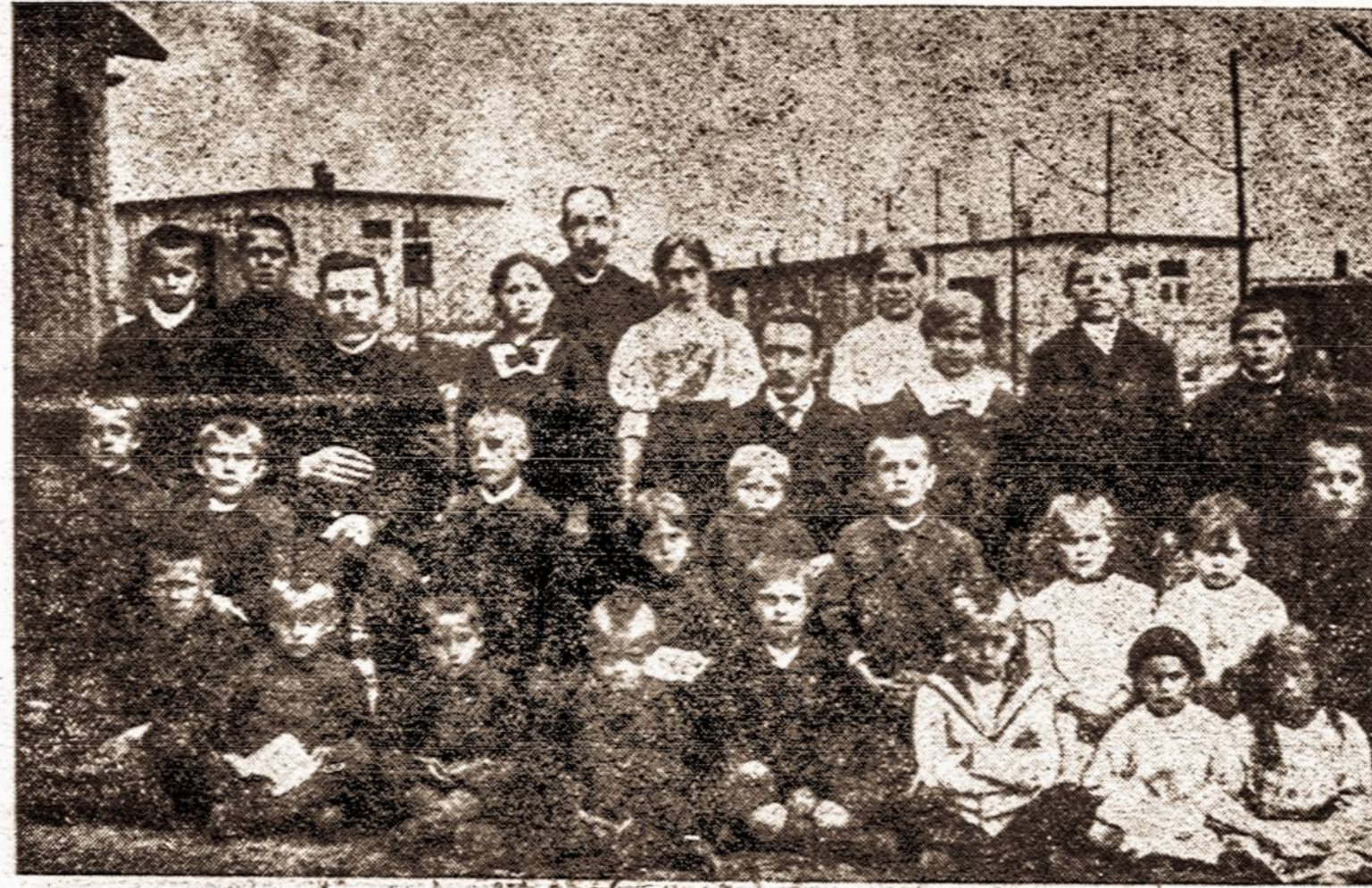
Lietuvių belaisvių mokykla už geležinių sienų.