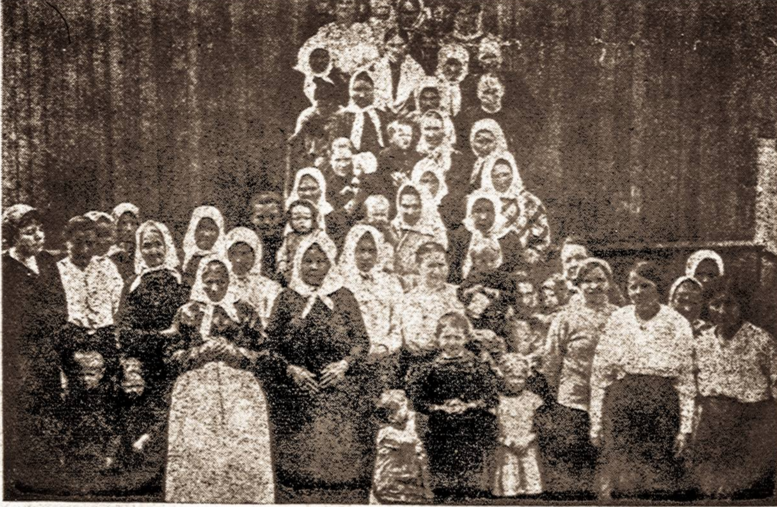
Lietuvių belaisvių išvežtų į Vokietijos gilumą mokykla Holzminden lageryje.

kuri vadina dokumentu „Q“ (nuo vokiško žodžio „quella“ reiškiančio šaltinį). Q turi gretumoj 180 posmelių (reiškia tėra tik vienas šeštadalio Mato ar Luko Evangelijų) *) Pagal vienų tyrinėtojų nuomonę, Q yra parašyta 50-60 po Kristaus Gimimui. Gi Morkaus Evangelija yra rašyta 70 m., Mato kiek vėliau, Luko apie 80 m., o Jono netoli šimtmečio pabaigos. O kiti tyrinėtojai stygaujia, kad Q parašyta 30 m. po Kristui (reiškia dar Kristui gyvam esant). Morko 50 m., Luko apie 58-61, Mato kiek vėliau, Jono tame pat laike, kaip pirma.