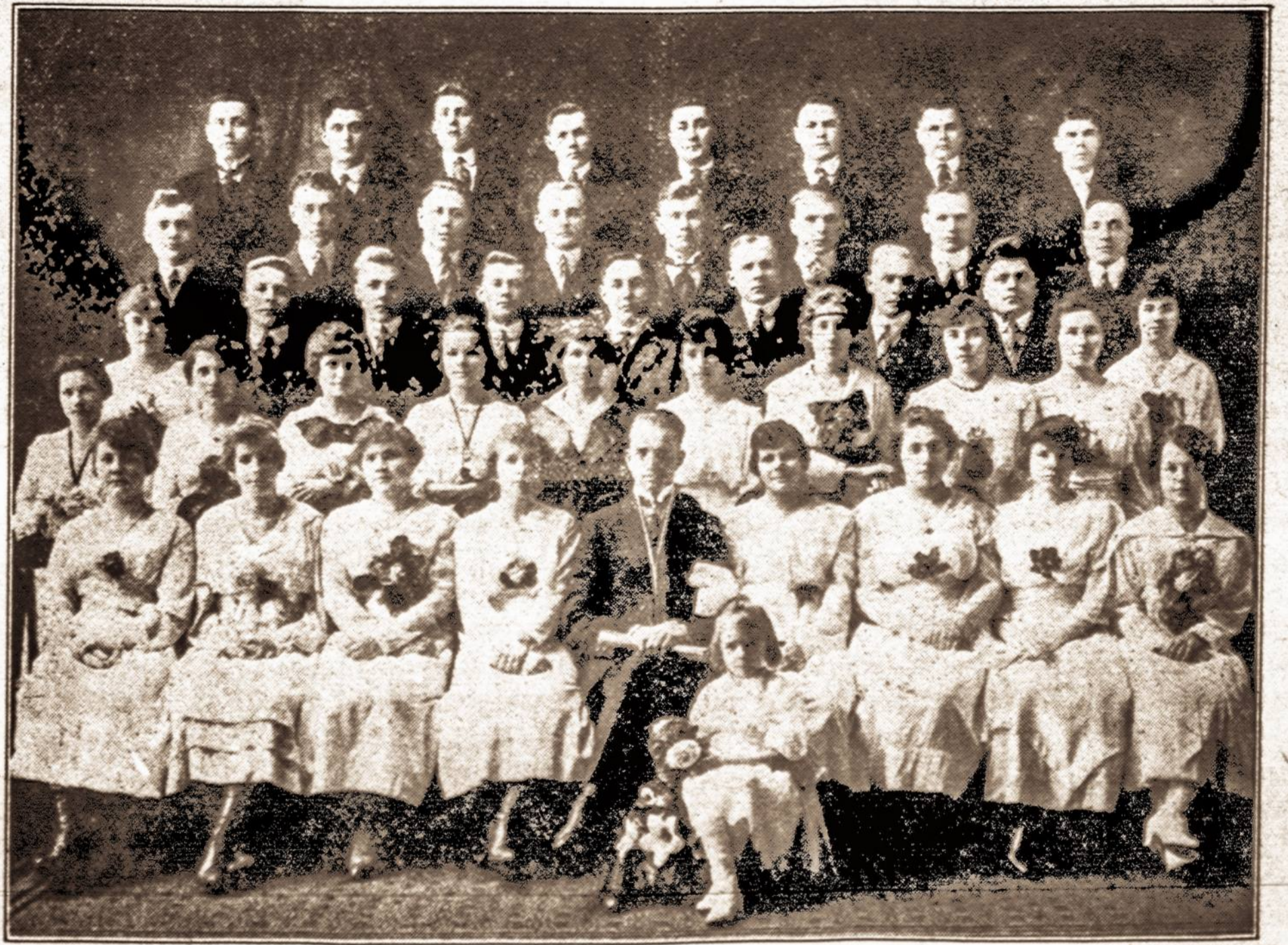
Teatrališka draugija „Aušra“ Waterburyje.