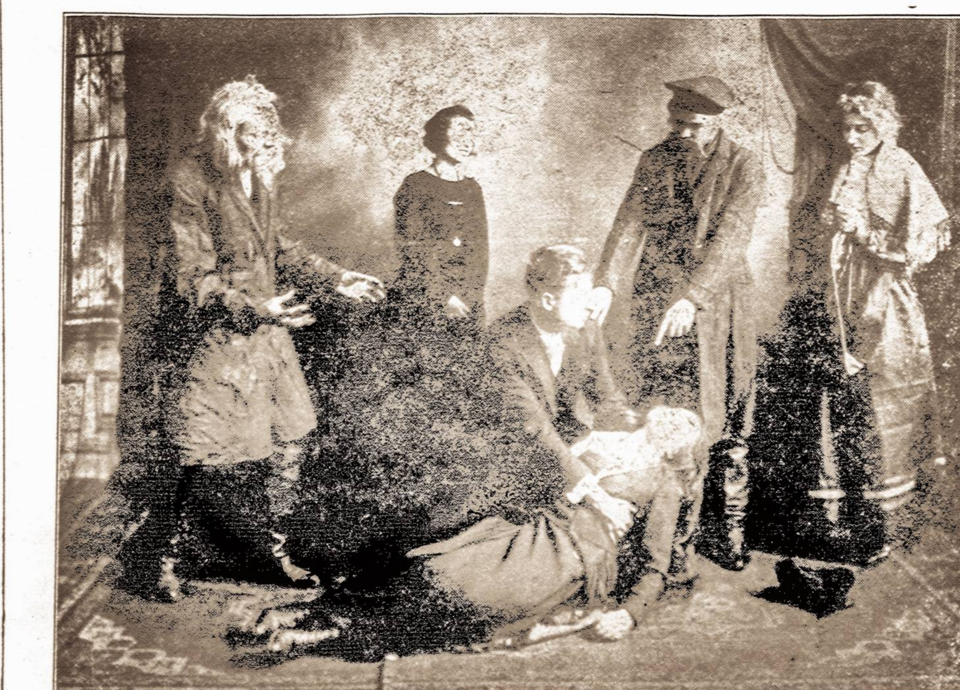
(Scena iš veikalo „Iš Meilės“)

Subatos vakare, 12 d. Balandžio-April, 1919 Pradžia 8 val. vakare McCADDIN HALL, Berry St. tarpe So. 2 ir 3 gatvių, Brooklyn, N. Y.