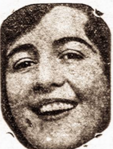
mas pagal reikalą.