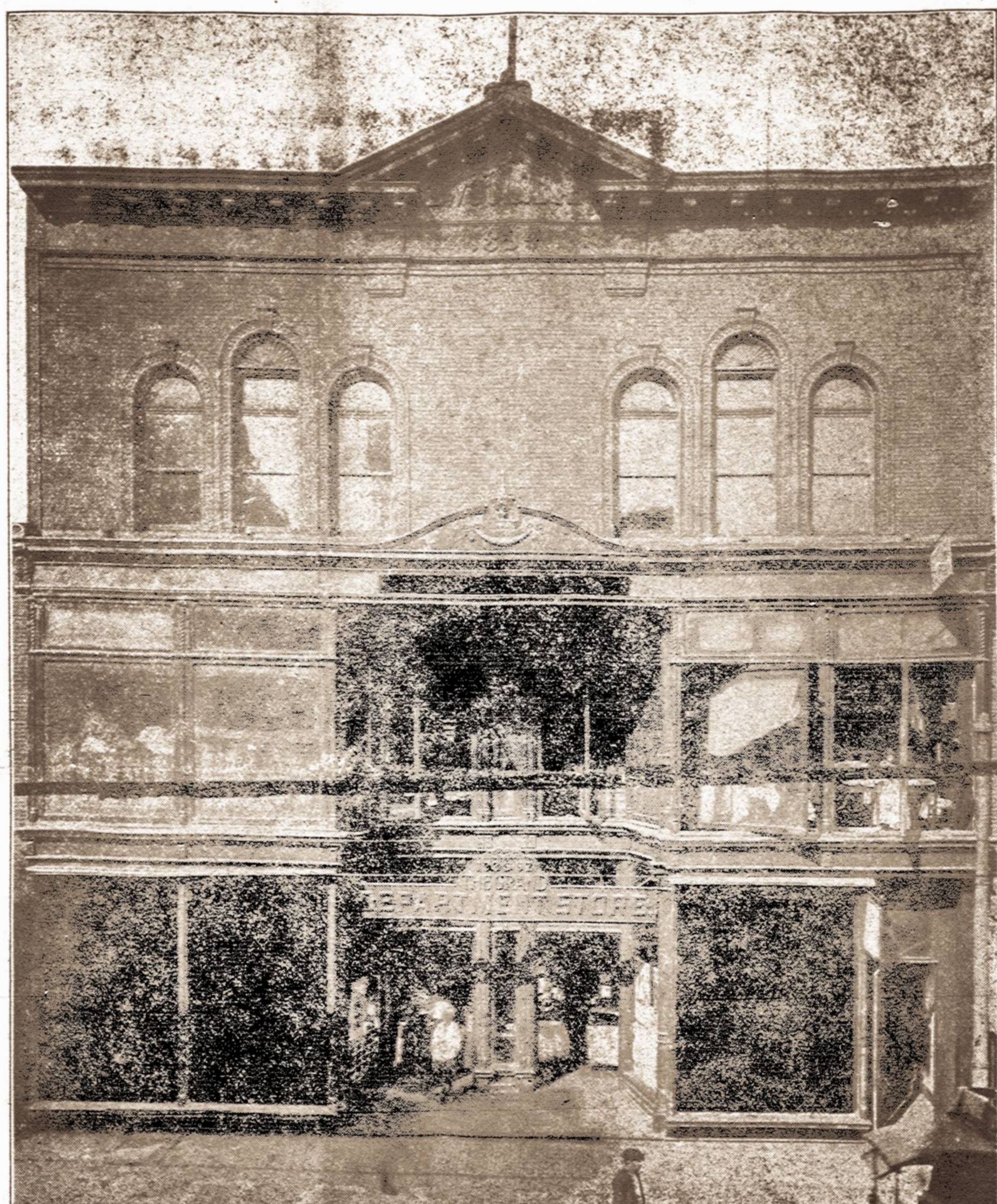
NAUJAI NUPIDKTASAI DIENRAŠČIO „VIENYBĖ“ NAMAS. 193-195-197 Grand Str., Brooklyn, N. Y.

Kopenhagen. — Suomų kariuomenė po vadovystė generolo Balakovich ties Bularata sumušė bolševikus. Su Pekin. — Čionai aiškiai lauzytos bolševikų karėivių kalbama, kad Japonijos valdžia tuojaus paskolins Kolčakui 25 milijonus dolarių. Užtai Ja-