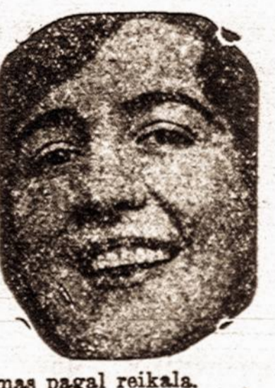
mas pagal reikalą.

Pėtnyčioms uđaryta. Nedėlioms nuo 9 A. M. iki 2 P. M.