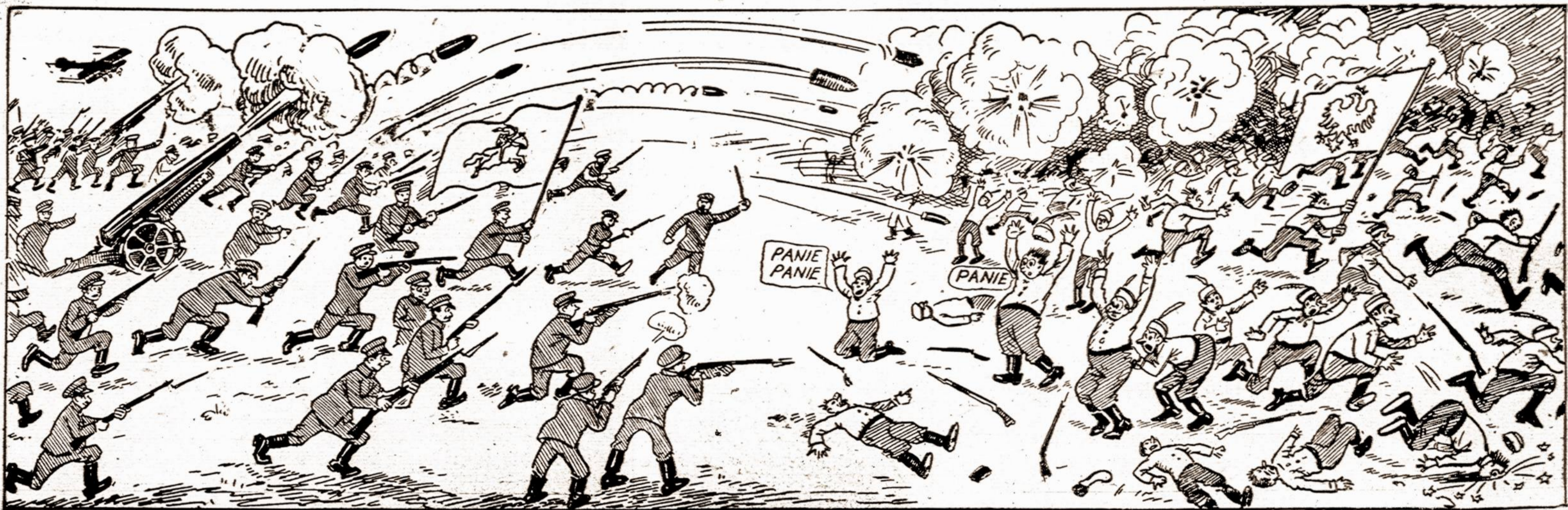
Jei mylite patis gardžiai pasijuokti ir kitus prajuokinti, tai parsitraukite šiu atviručių (Post Cards). Mes turim ir kitokių kaip tai: Lietuviai veja Paderewski Varšvos lmk. Lietuvos išmūša lenkų iš Lietuvos, Bolsėvikižiro platiniojai ir kitokių. Jos visos gardžiai spalvotos. Kaina 50c. už tuziną — stampoms arba money orderiu Adresuokite: — LITHUANIAN PRESS, 196 New York Ave., New York, N. Y.

Tėmykit — šimet geriausia ir pigiausia Kalėdinė Dovana į Lietuvą, tai Lietuviški kalendoriai, kuriuos A. Laukžemis išdirba. Kaina 1 už 25, 5 už $1.00