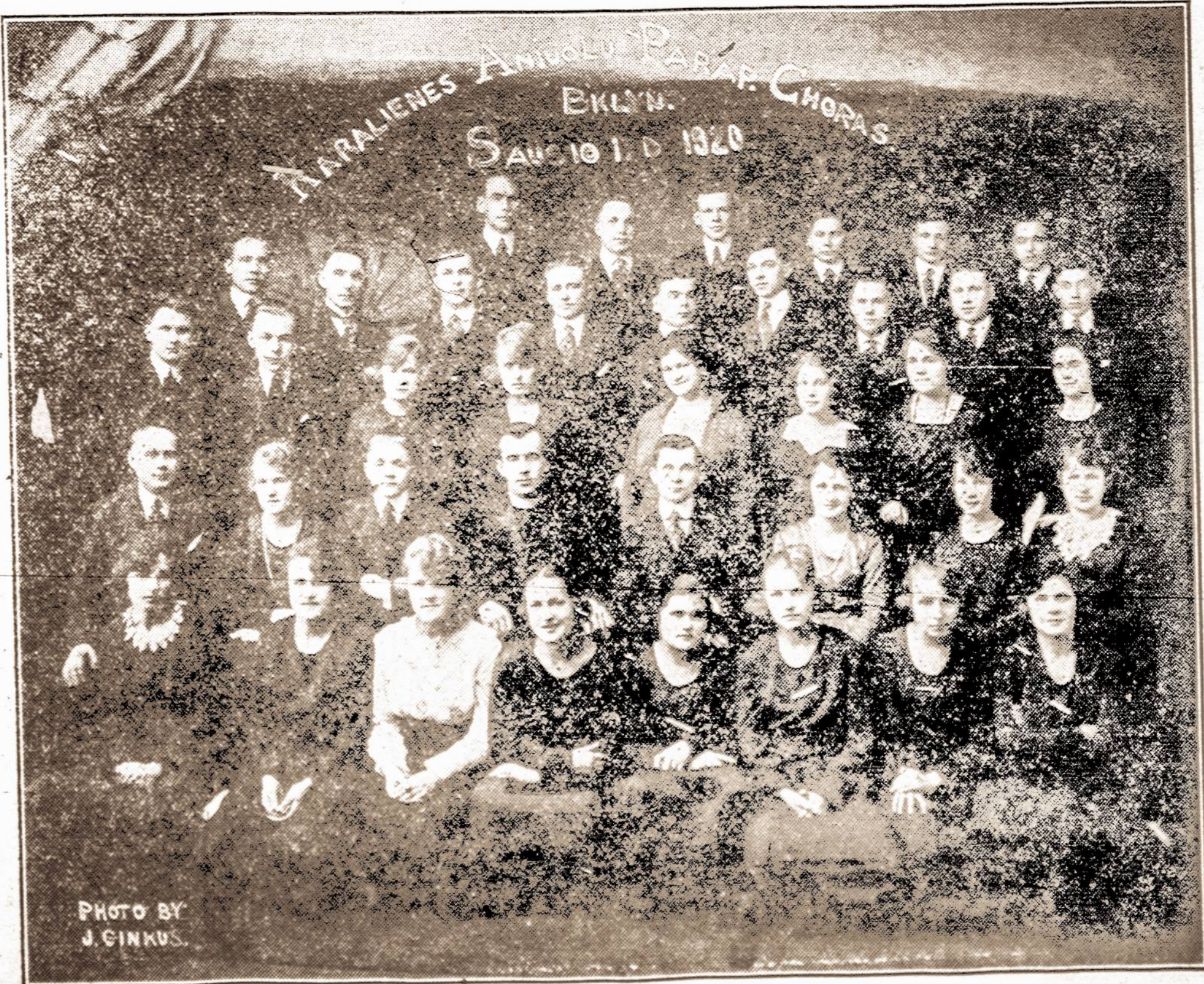
SUBATOJE, SAUSIO 31 D., 1920 M., McCADDIN SALEJ, TARPE SO. 2-ros IR 3-čios GATVIŲ

Kas turite nušampus plaukus, bet niežėjimf galvos odos, pleiskanais, puolime ir žilumą plaukų; retus plaukus taipgi spugnos arba šašus, duokite savo antrašą ir 2c. stampa. THE WESTERN CHEMICAL CO. Box J, Berea, Ohio. (6)