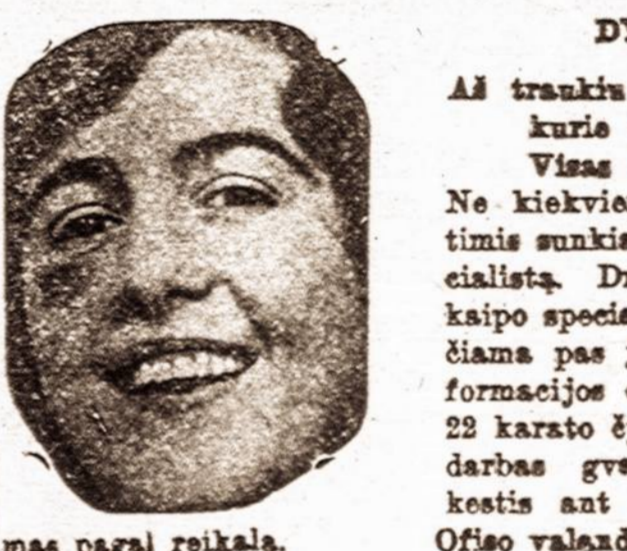
mas pagal reikalą.

Jeigu ant pokello nėra vaizbaenklis ikaro, tai jis nėra tikras ir jus tokio neimkite. Visose aptiekose po $5c. ir 70c. Taipgi galima gauti pas išdirbėjus: F. AD. RICHTER & CO., 326-330 Broadway, New York