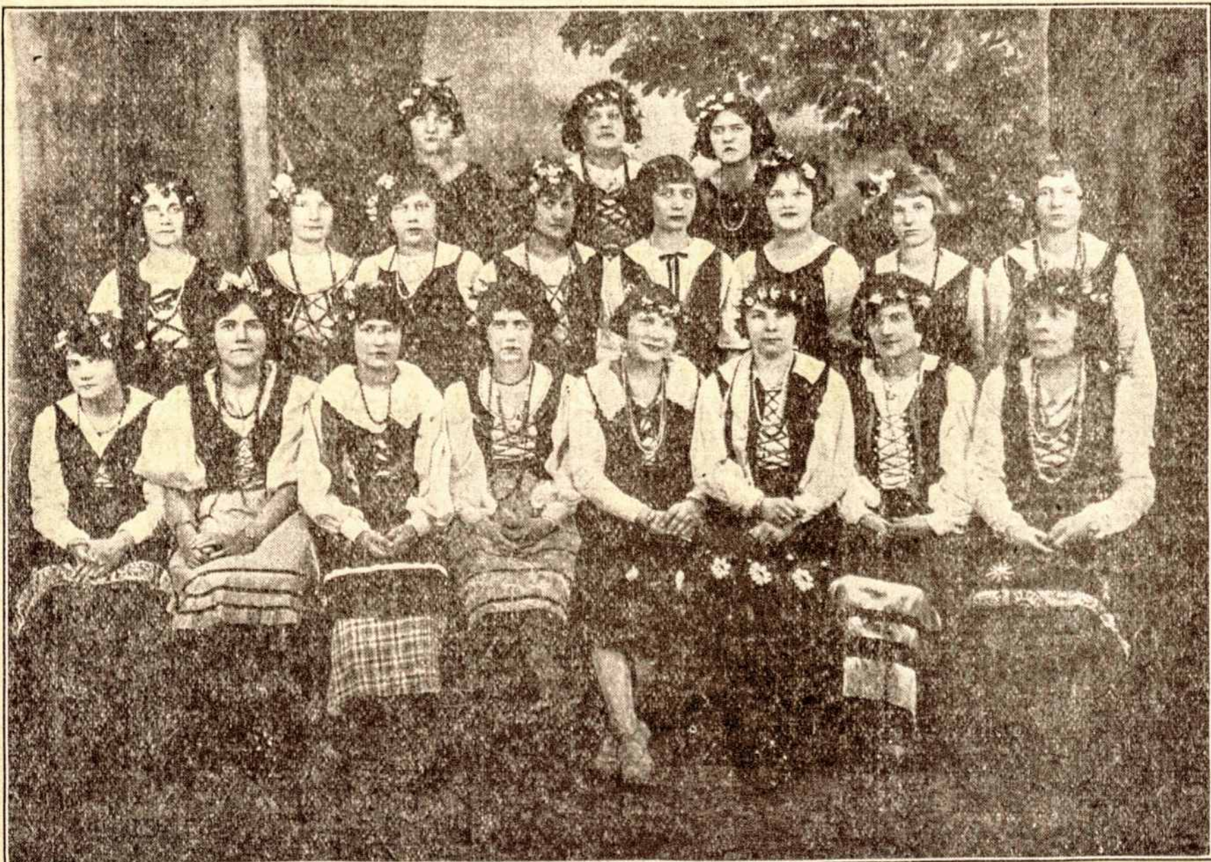
OPERETĖS MERGINŲ CHORAS

"Vienybėje" pas Ambraziejų Brooklyn Academy of Music ir pas visus Operetės Draugijos narius.