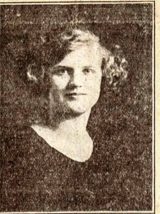
P. I. A. C.

Nuo 3 iki 8 d. Kovo, 1924 71st Regiment Armory, New York.