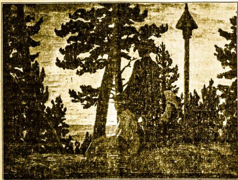
ANT BIRUTĖS KALNO.

„Vienybė“ jau eina tris kartus savaitėje. Tai įrodo, kad mūsų biznis kyla. Kyla tad ir „Vienybės“ šėrai. Vienas šėras kai- nuoja tik $10. Pasipirk nors vieną šėrą. Tai gera pi- Rep.