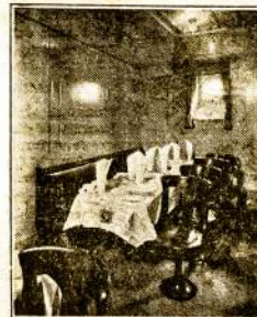
Vaikų Valgomasis Kambarys

Yra puikūs 3-čios klesos kambariai po 2, 4 ir 6 lovas.