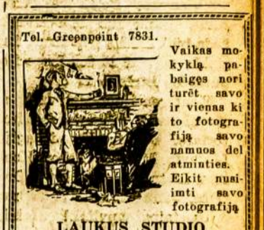
LAUKUS STUDIO 308 BEDFORD AVE. KAMPAS NO. 1-MOS BROOKLYN, N. Y.