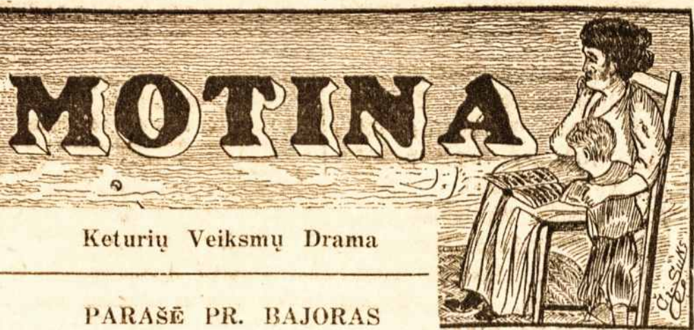
Keturių Veiksmų Drama

"MOTINA" yra tai Amerikos lietuvių gyvenimo pasaka. Labai įdomi skaitymui ir tinka vaidinimui scenoje. Ji vaizduoja tai, kaip tūla motina, paliko savo vyrą bei kūdikį ir pabėgo su kitu vyru. Kas toliau nutiko — sužinosit skaitydami.