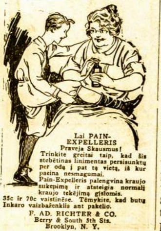
Lai PAIN- EXPELLERIS Pravie Skausmus! Trinkite greitai taip, kad iš- stebėtinas linimentas persisauktų per odą į patį vietą, iš kur pajėta nesmagumai. Pain-Expelleris paleidžia kraujo sukėpimą ir atstieigia normalų kraujo tekėjimą gliedams. 5c ir 70c vaistinėse. Tėmykite, kad butas Inkaro vaistažolėms ant pakelės. F. AD. RICHTER & CO. Berry & South 5th Sts. Brooklyn, N. Y.

Išgirdau daug neteisy- bės, tik vienas gyrimas: kad latviams gerai einasi, kad francų profesoriai jų knvgas perrašinėja (!), kad anų kalba seniausi, ir kad latvių gyventojų esą pusketvirto miliono (o ne- syki man teko matyti, kad latvių yra tik 1,800,000!). Papasakojo, kaip ji visur važinėjusi ir skleidusi prop- agandą apie Latviją ir tuomi Latviją gavusi garbę. Siandien latvių opera esanti "garsiausi" visoje Euro- poje; kad Latvija labai mo-