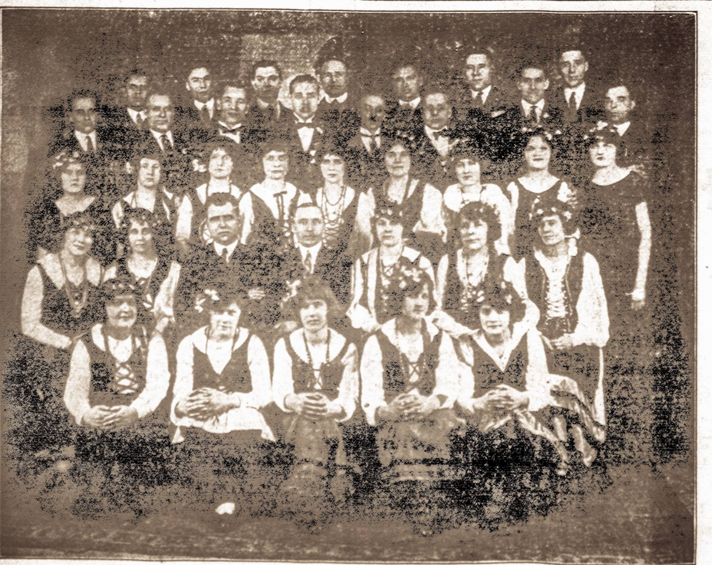
LIETUVIŲ OPERETĖS DRAUGIJA IR HORAS, KURIS DALYVAUS "VIENYBĖS" IŠVAŽIAVIME RUGSĖJO 29, 1926 M.