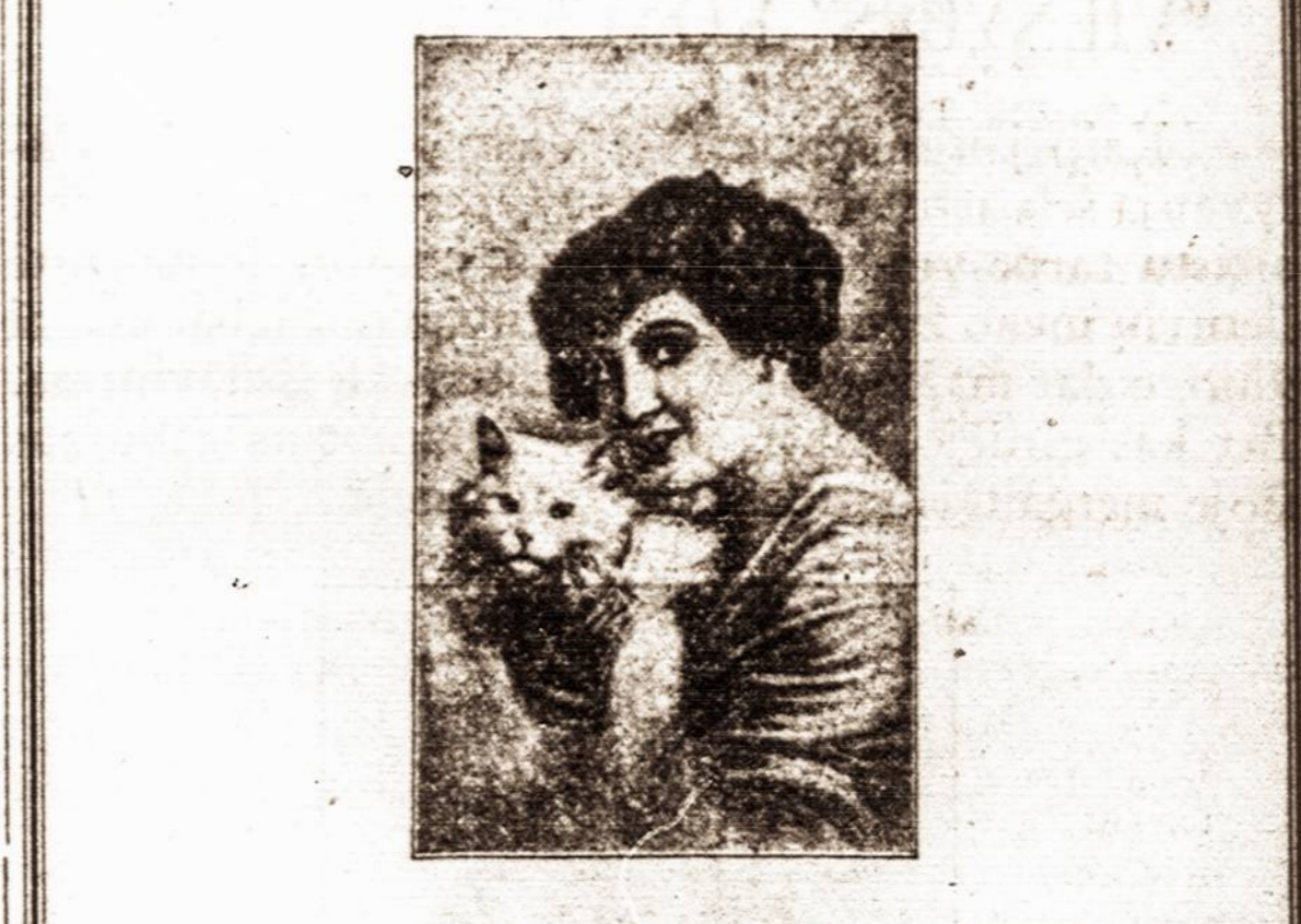
Mergina su Kačiuku. NUMERIS 11893.