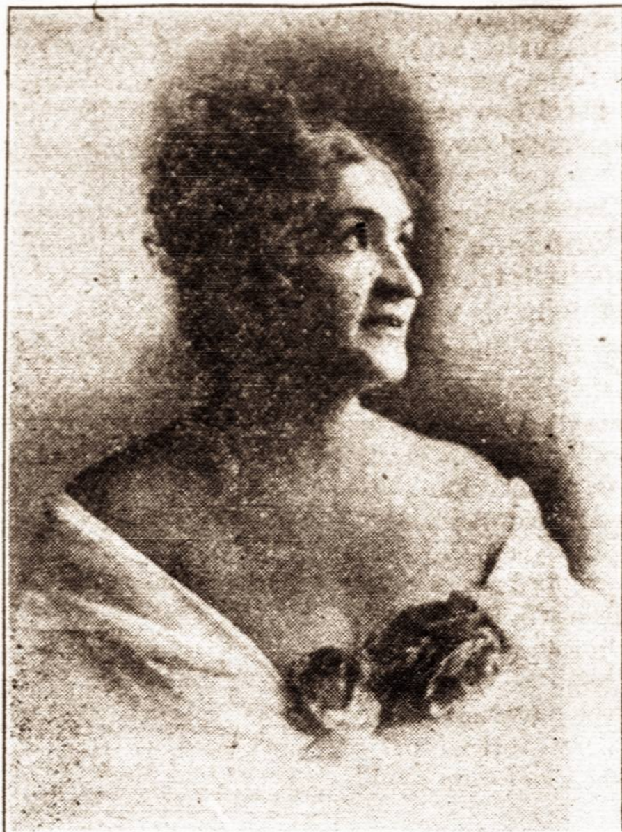
LIUDA SIPAVIČIUTĖ, Kontralto