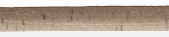
CUNARD LINE, 85 Broadway, New York

I Lietuvą greitai laiku. Išplaukimas kas Seređa. Keleiviai nepiliečiai į-leidžiami be kvotos varkymų. Visi 3 klasės keleiviai turi kambarius. Nepri-lygtamas švarumas. Puikus maistas. Kreipkitės prie vietos agen-ty ar į