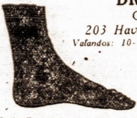
Pedic Remedy — greitai pagelbės. Bonka $1.00. Užsakymus ir pinigų siūskite mano ofiso adresu.

Mano Hygieniški Milteliai tikrai paliaus nuo kojų nemalonus kvapo, persėjimo, nictėjimo ir tt. Stiklas $1.00. — Skaudamiems kojų muskulams, nuvargusioms kojoms ir tt vartokite Dr. Gillin's siūskite mano ofiso adresu.