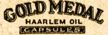
Isklokite vardo GOLD MEDAL ant dėžutės ir neimkite kitokių.

Strėnų skaudėjimo kan- čios, vėmimas ir silpnu- mas, ištinę kojos dažnai pa-