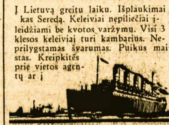
CUNARD LINE, 85 Broadway, New York

I Lietuvą greitai laiku. Išplaukimai kas Seređą. Kelviečiai nepiliečiai leidžiami be kvotos varžymų. Visi 3 klasės kelviečiai turi kambarius. Neprilygtamas švarumas. Puikus maistas. Kreipkitės prie vietos agentų ar į