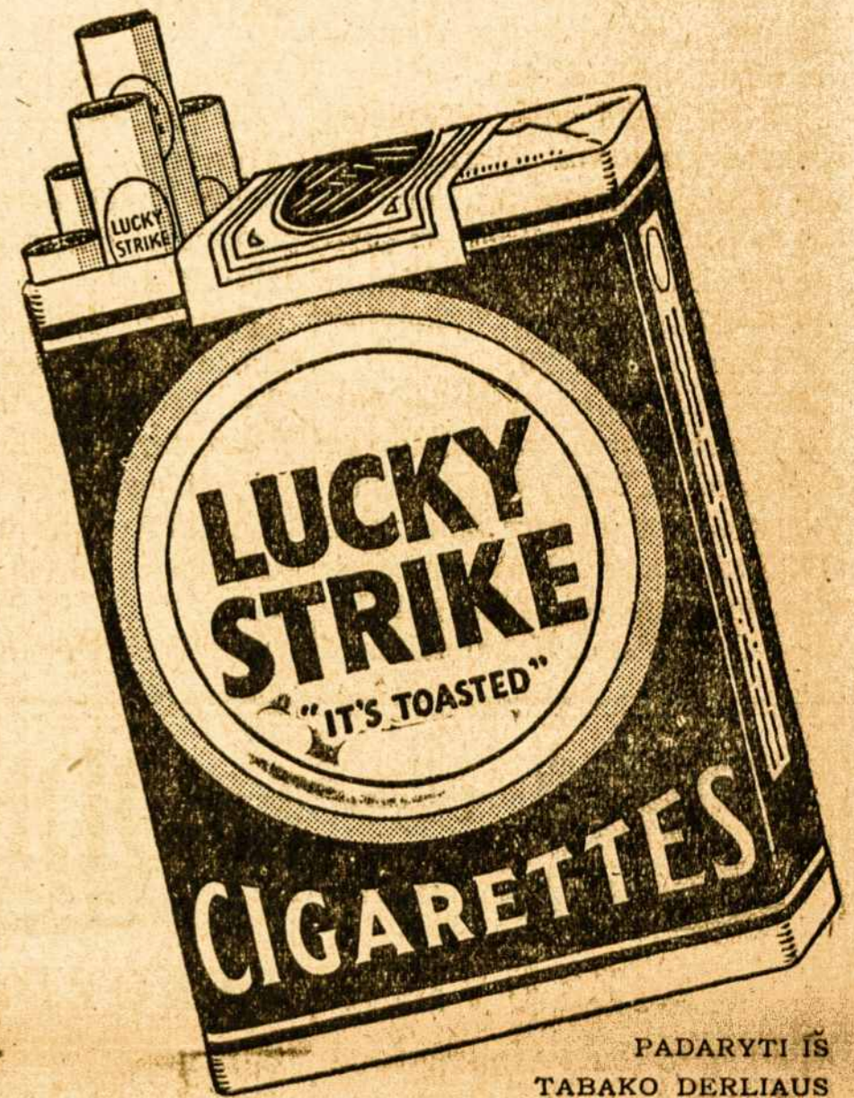
PADARYTI IŠ TABAKO DERLIAUS SMETONOS

Jūs taipgi atrasite, kad LUCKY STRIKES suteikia didžiausio smagumo — švelnūs ir Malonūs, puikiai cigaretai, kokius tik kada esate rūkę. Padaryti iš parinktiniausių rūšių tabako, tinkamai išsistovėjusio ir labai gambiai sumaišyto; o aparty, yra dar ir specialis procesas — "IT'S TOASTED" — ir nei jokio šiurkštumo, nei mažiausio kirpimo lūpų bei liežuvio.