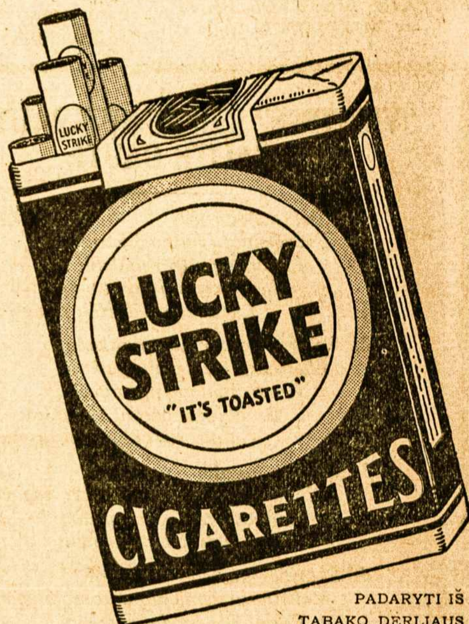
PADARYTI IŠ TABAKO DERLIAUS SMETONOS

Jūs taipgi atrasite, kad LUCKY STRIKES suteikia didžiausio smagumo — Švelnūs ir Malonūs, puiki- ausi cigaretai, kokius tik kada esate rūkę. Pada-ryti iš parinktinių rūšių tabako, tinkamai išsistovėjusio ir labai ga-biai sumaišyto; o apart to, yra dar ir specialis pro-cesas—"IT'S TOASTED"—ir nei jokio šiurkštumo, nei mažiausio kirpimo lūpų bei liežuvių.