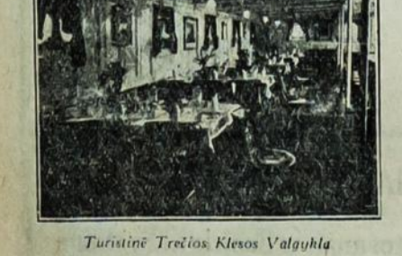
Turistinė Trečios Klesos Valgykla

Kajutos yra privatus, ruimingos, po dvi, tris, keturias ir šešias lovas grupėms arba šeimynoms. Dideli, atviri ir pridenyti pasivaikščiavimo dieniai, skiriamieji išimtinam naudojimui trečios klesos keleiviu.