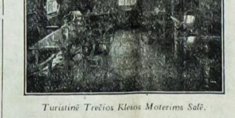
Turistinė Trečios Klesos Moteirims Salė.

Atydžiui skaitytis apie šią turistinę trečią klesą ir pasinaudokit. Didelė dauguma manančių keliauti svarsto šiaip: "Antra klesla gal per brangu", "Trečia klesla tai lyg ne suvis patogus."