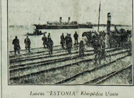
Lauva "ESTONIA" Klaipėdos Uoste

Patartina pirkti laivakortes abipus išanksto, tuomet succėdysit $44.50. Pavyzdin — į Klaipėdą trečia klesla $107; iš Klaipėdos $118.50; viso $225.50. Perkant išanksto abipus mokat tiktai $181.00.