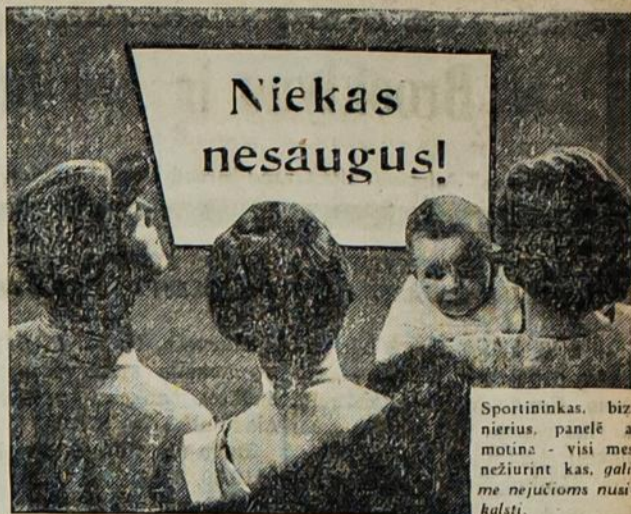
Sportininkas, bizeris, panelė ar motina - visi mes, nežiurint kas, galime nejuokiams nuakalsti.

Svietas margas, o jų korespondentai dar margsni, spalvuoti. Žinios priklauso nuo korespondentų ir jų sąžinės, o ne nuo kokių kitų aplinkybių. Ką parlamentai nutaria, tas žinoma, bet kas ten vidų atsitinka, tai jau nepasako per radio; liekasi tarpe jų. Veikiama visų, kad išvengtų blogų pavyzdžių davimo, kas yra kenkminga plačiai visuomeni.