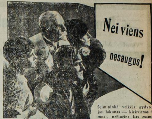
Scimininkė, veiktėja, gydytoja, lakunas — kiekvienas iš mus, nežinint kas esame, galime nejučiomis nuškalsti.