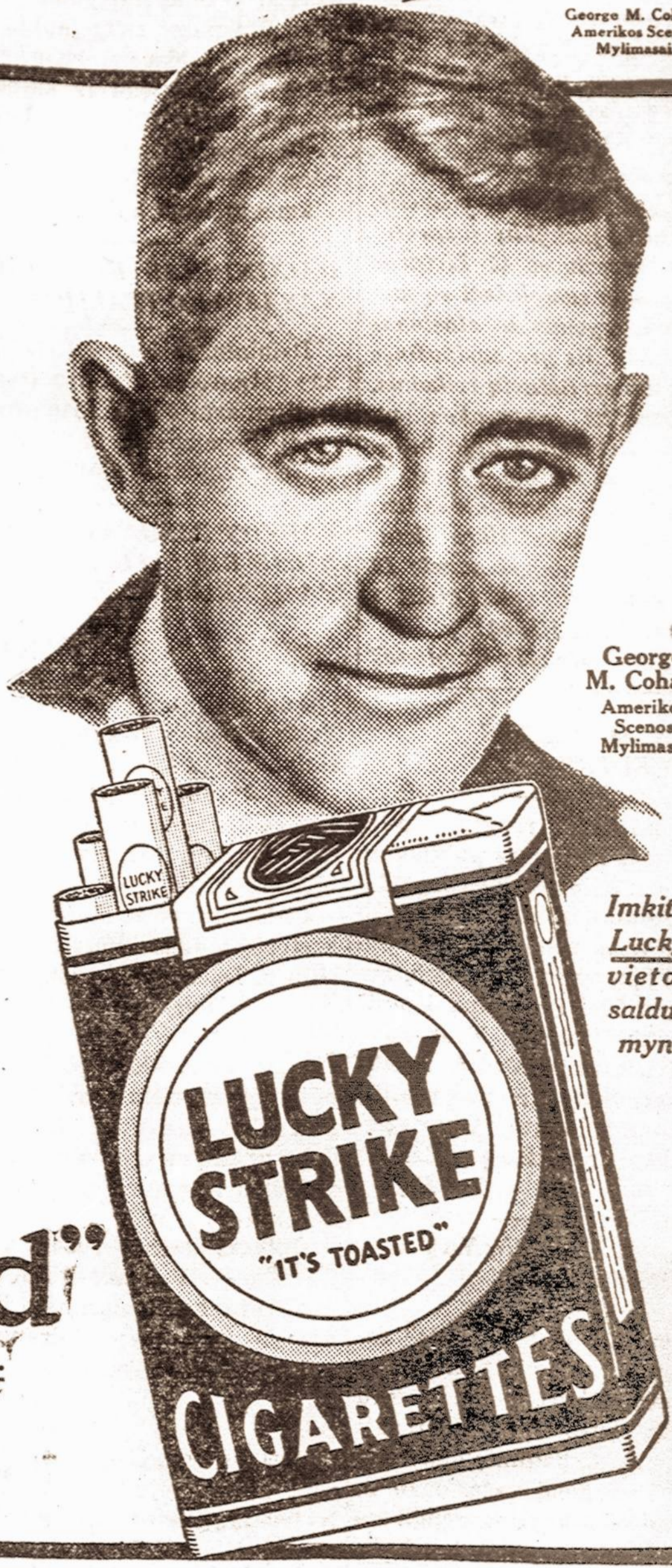
George M. Cohan, Amerikos Scenos Mylimasis

© 1929, The American Tobacco Co., Manufacturers