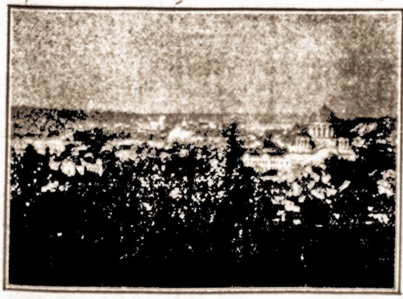
KAUNAS — Laikinoji Sostinė

"VIENYBĖS" EKSKURSIJA 193-197 Grand Street, Brooklyn, New York