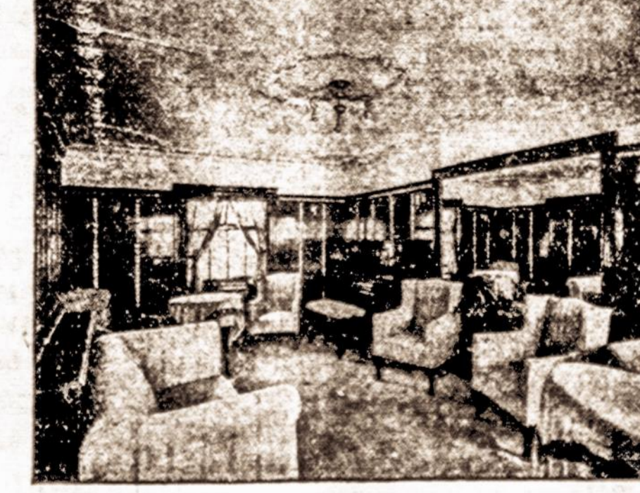
MOTERIMS POILSIO KAMBARYS

(Baltic-American Linija laivą šiai ekskursijai paveda VIENIEMS lietuviams ekskursantams.)