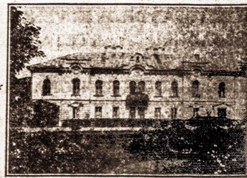
LIETUVOS PREZIDENTO RŪMAI

ATSIŽVELGDAMA Į SKAITLINGĄ EKSKURSIJĄ GEGUŽĖS 18 D. IR PILDYDAMA AMERIKOS LIETUVIŲ NORĄ, BALTIC AMERICA LINIJA NUTARĖ TĄ NORĄ PATENKINTI IR RENGTI EKSKURSIJĄ BIRŽELIO 18 D., 1929 M.