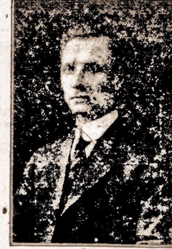
A. B. Strimaitis Kas turite savo namuose Ra...

(Skelbimas) Spalių 19-tą dieną, 7:30 v. vakare, per Radio stoį WRNY lietuviai pateikia lietuvišką programą.