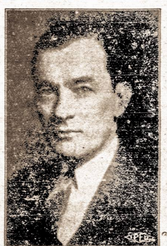
Buvęs ir Busiantis New York Miesto Mayoras Jas. J. Walker

New Yorko valstijos konstitucijos penki pataisymai užgirti išėmus vieną, kuris abejotinas. Tai pakeitimas civil service įstatymo liciančio ekskareivius, kuris pagalvina ekskareiviams gauti pirmenybę civil service valdžios darbus. Kiti pataisymai liečia New Yorko po licininkams ir ugnagesiams