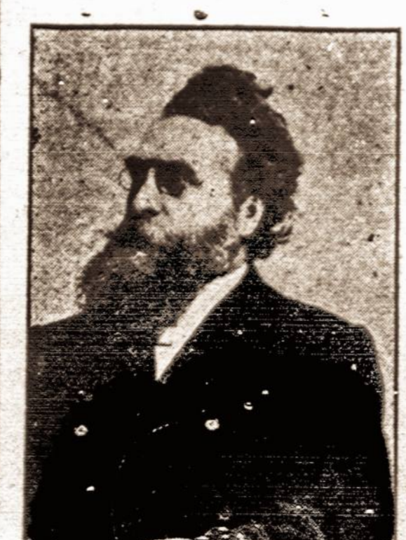
A. A. Dr. Jonas Basanavičius,