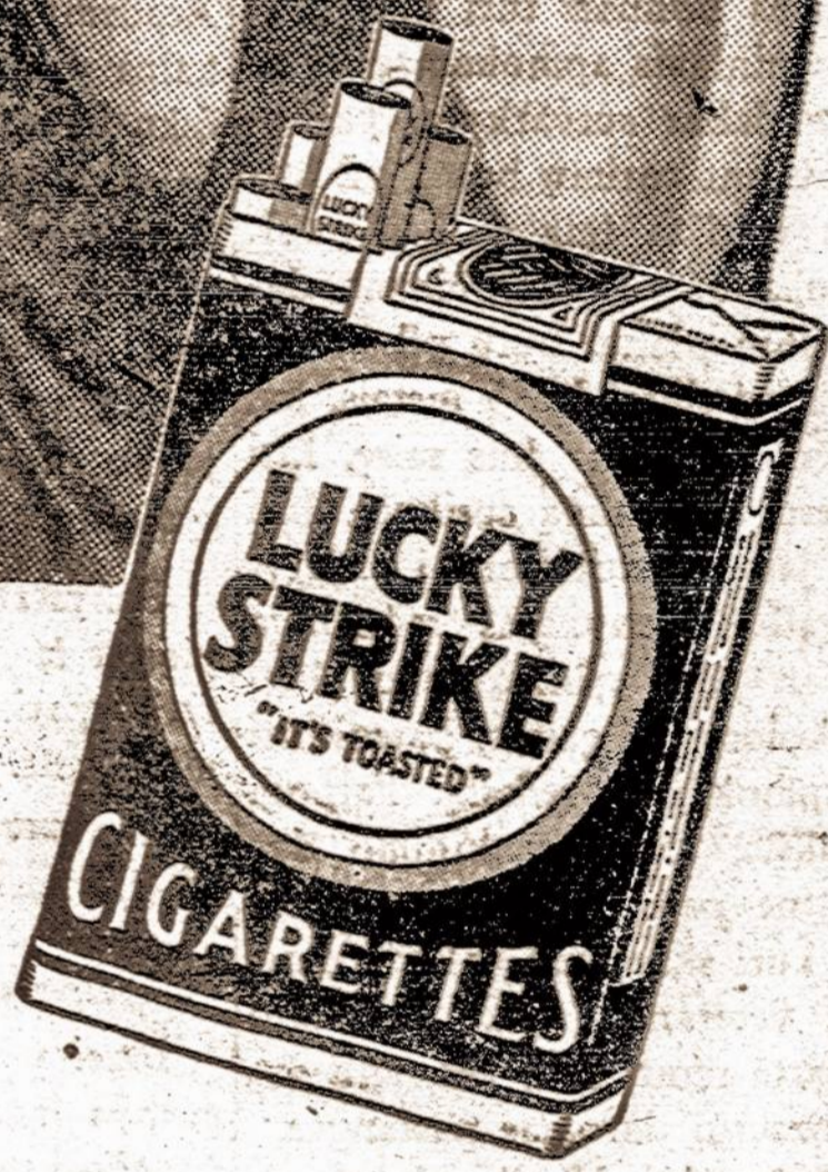
© 1931, The American Tobacco Co., Inc.

Jūsų Gerklės Apsauga — Prieš knifėjimus — prieš kosulį