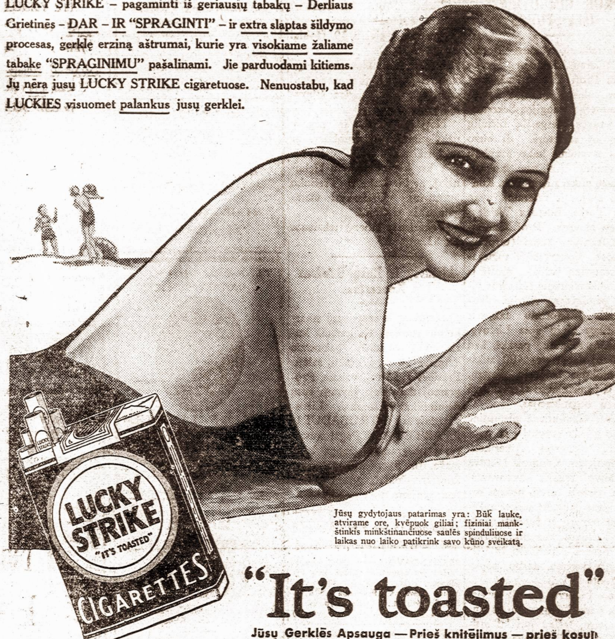
Jūsų gydytojas patarimas yra: Būk lauke, atvirame ore, kvėpuok giliai; fiziniai minkštinkis minkštinančiuose saulės spinduliuose ir laikas nuo laiko patikrink savo kūno sveikatą.

Kiekvienas žino, kad saulė nokina - del to "SPRAGINIMO" proceso naudojami Ultra Violetiniai Spinduliai. LUCKY STRIKE - pagaminti iš geriausių tabakų - Derliaus Grietinės - DAR - IR "SPRAGINTI" - ir extra slaptas šildymo procesas, gerklę erzina aštrumai, kurie yra visokiame žaliame tabake "SPRAGINIMU" pašalinami. Jie parduodami kitiems. Jų nėra įsū LUCKY STRIKE cigaretuose. Nenuostabu, kad LUCKIES visuomet palankūs įsū gerklei.