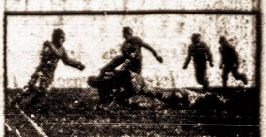
Veteranai parodo savo galę.

Amerikonams vis daugiau ir daugiau pasirodo, kad lietuvių tauta ne šiaip kokia, bet prakilni ir gabi tauta. Linkime kuogeriausiai pasisekti tapti pasaulio sportininku žvaigžde! Bet ir nepamiršti lietuvių brangaus vardo! Senas Kareivis.