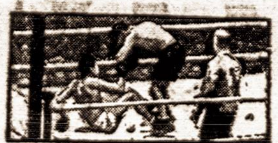
Hartfordo lietuvių sportas.

Na, nežinoma ar "pažangus žmonės" iš "Keleivio" ir "Naujienų" abazo tai "Tėvynės" minčiai pritaras, bet vis delto įdomu, kad "Tėvynė" patvirtina poziciją, kurią "Vienybė" tuoj po perversmo paėmė. Kada kiti sukavo, Lietuvos valdžią griauti ir jos vadus išskirti, ar sušaudyti, "Vienybė" ir "Dirva" buvo vieninteliai Amerikos lietuvių laikraščiai, kurie drąsiai pakėlė balsą, visuomenei įrodinėti, kad ne perversmų keliu reikia apardyti Lietuvos vildaus santvarką atitaisyti.