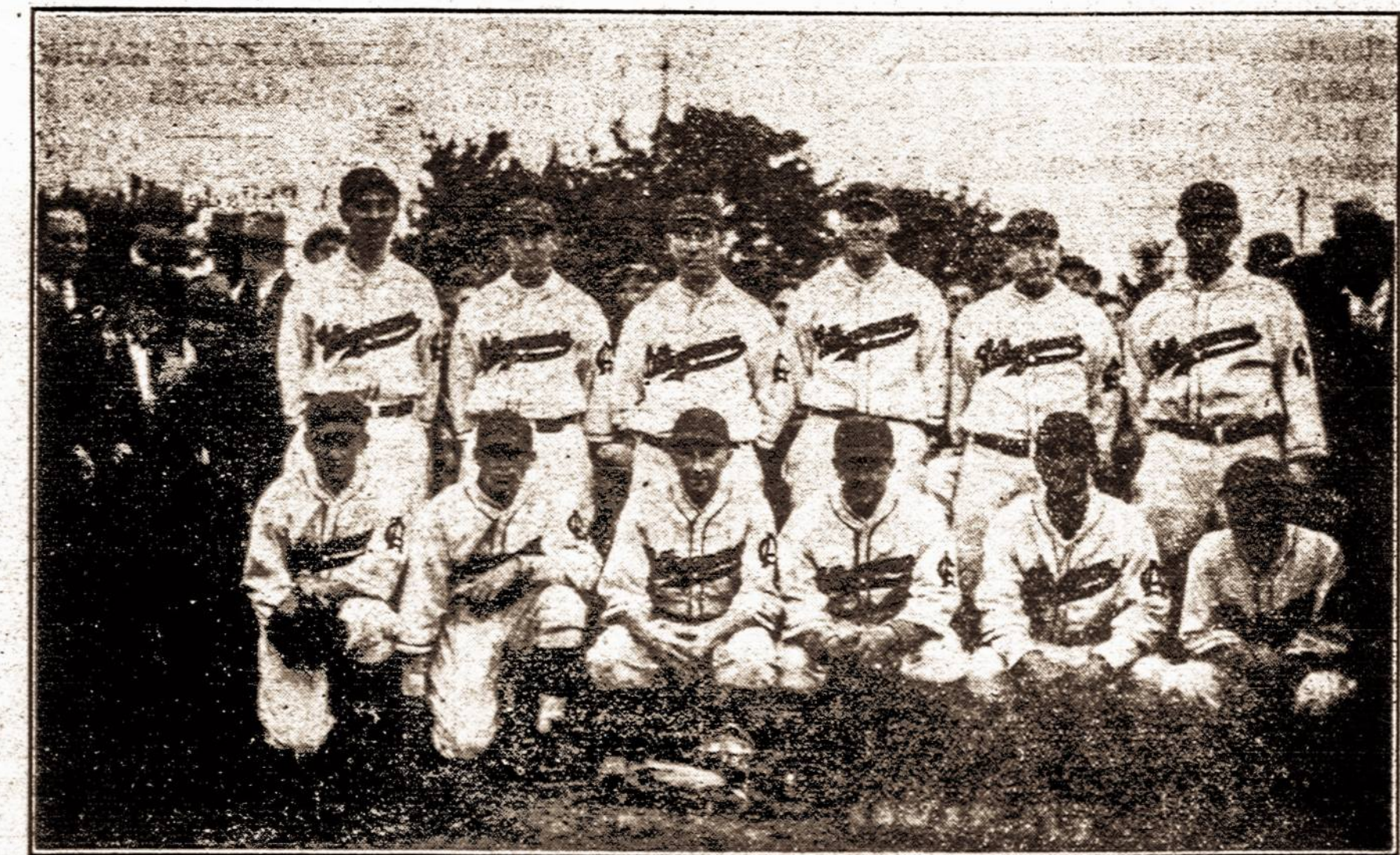
LIETUVIŲ ATLETŲ KLUBO PASIŽYMEJES BASE BALL TYMAS

Šį pavasarį minėtas tyamas turėjo 6 žaidimus ir visus laimėjo. Sekantį sekmadienį, geg. 17 d. loš su labai stipriu tyvu — Emerson A. C. Lošimas visada buna L. A. Klubo Base Ball Field, Remson Aye. ir Ave. B, Brooklyn, N. Y.