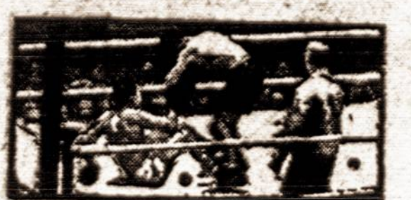
Schmelingo-Striblingo baute faulas nebus pripažintas