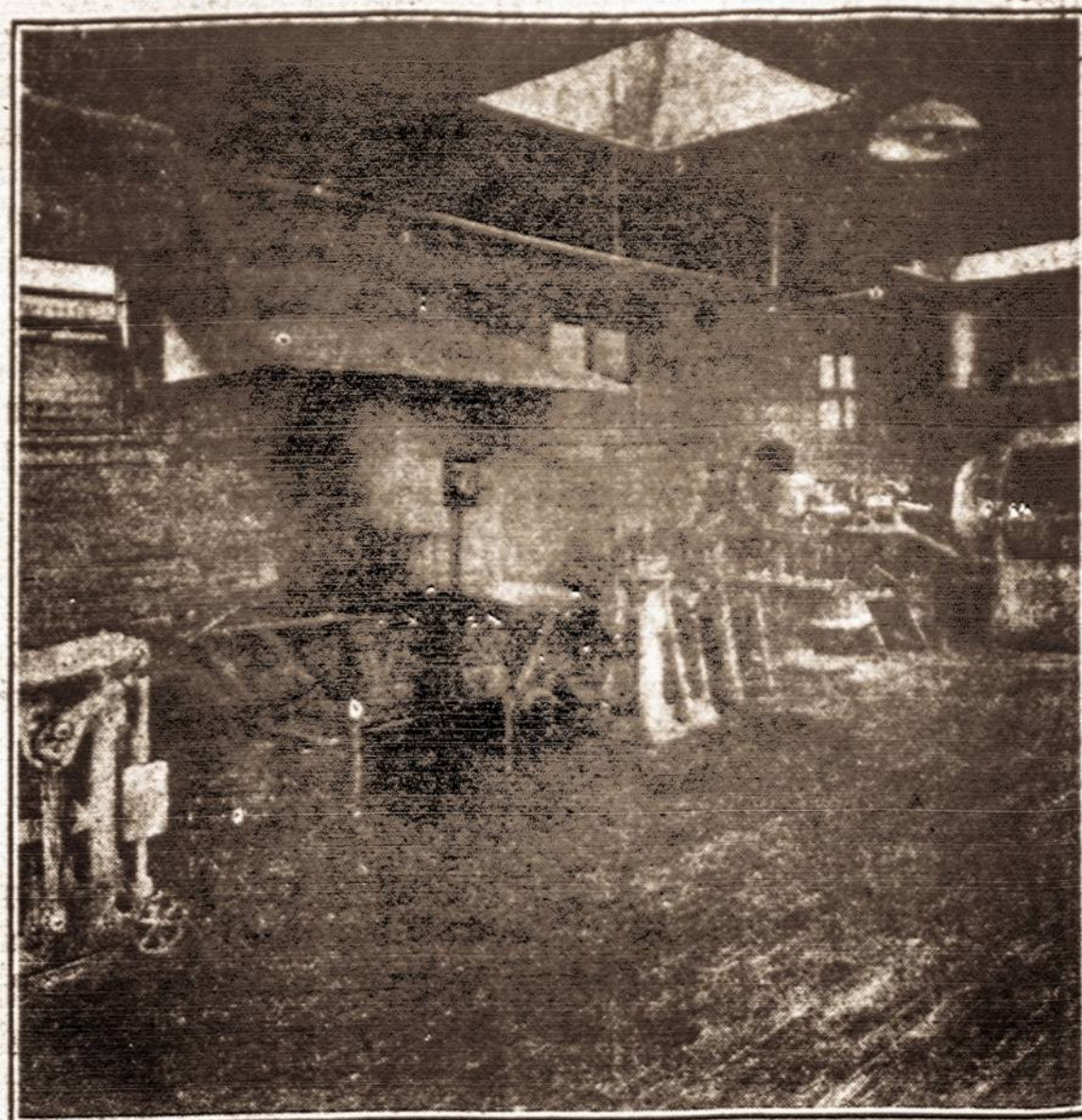
Kekų Maitymo Kambarys

— Kad jis ir taip gauna algą. Jam kaimynai sūdeda, kad tik tylėtų.