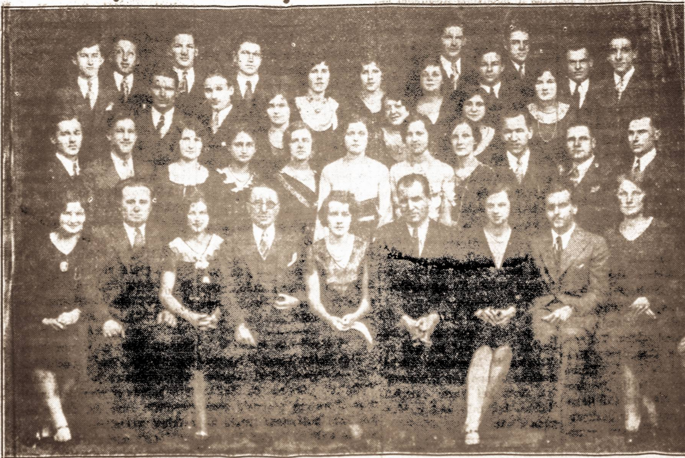
OPERETĖS CHORAS. Brooklyn, N. Y.