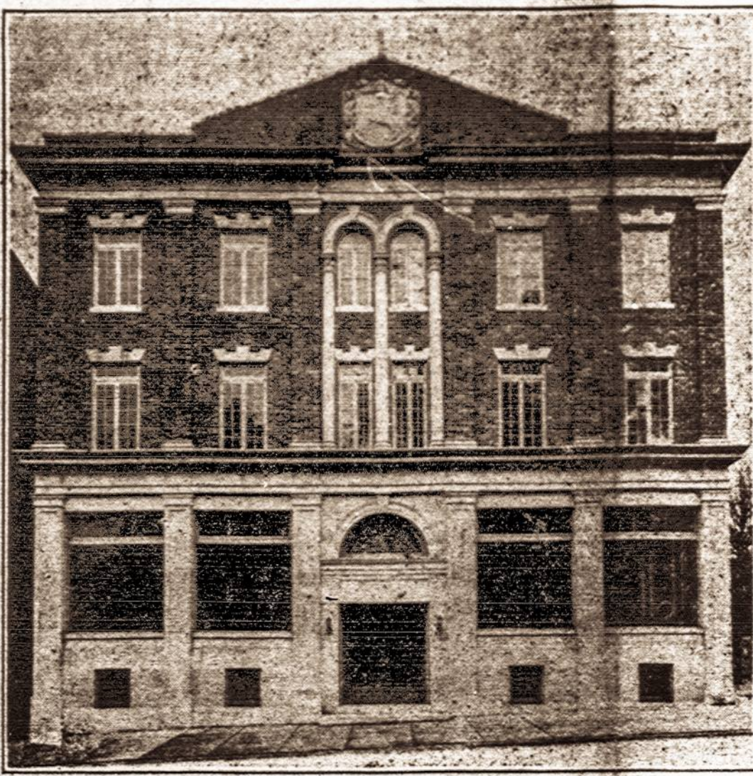
BALTIMORĖS LIETUVIŲ SALES NAMAS

851-853 Hollins St., Baltimore, Md. Tai viena gražiausių lietuvių salių Amerikoje. Beje, šes-tadienį ir sekm., spal. 17 ir 18 dd. joį įvyksta jos pačios 10 m. iškilmingos sukaktuvės su gražiu bankietu, kalbomis ir koncertu. Plačiau žiūrėkite korespondencijose