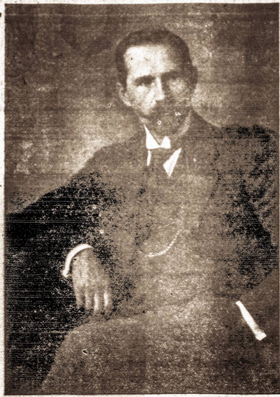
A. Smetona Lietuvos V. Prezidentas.