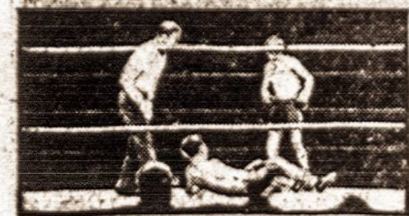
Carnera kumščiuosis su Campolo

New Yorko Boxing Commission neseniai sudarė taip vadinamą "Dreadnought" — kumštinių klase, arba sunkesnių sunkaus svorio klase, kurion patenka visi vadinami "milžinai." kaip Carnera, Campolo, Redmond ir kiti.