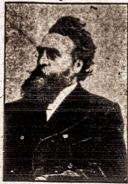
LIETUVOS TĖVAS... DR. JONAS BASANAVIČIUS

Švenčiant vasario 16-ą, negalima nepaminėti tų vyrų, kurie tautą prikėlė iš nelaisvės.