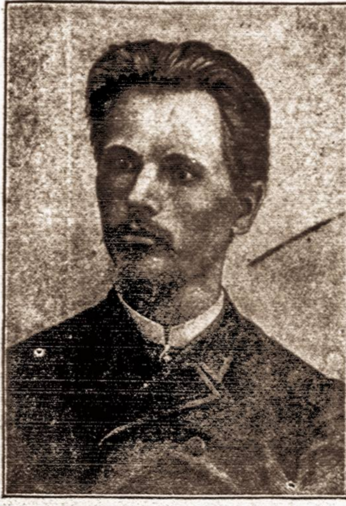
Taip pat uolus ir savo darbais nemirtingos garbės užsitarnavęs! DR. V. KUDIRKA

Nuo pereinamo liepos mėn. Indiana vieno ukininko kiuaulė palengvėjo net 350 svarų... Aukščiausiasioj vietoj pasauly telefonas yra Pike's Peak, 14, 110 pėdų aukščiau vandens paviršiaus.