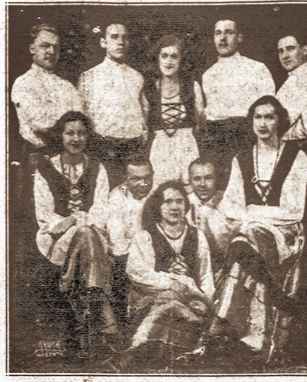
Dalyvaus "Vienybės" Lietuvių Liaudies Vakare, lapkričio-November 27 d., Arcadia Ball Room Hall, Brooklyn, N. Y.